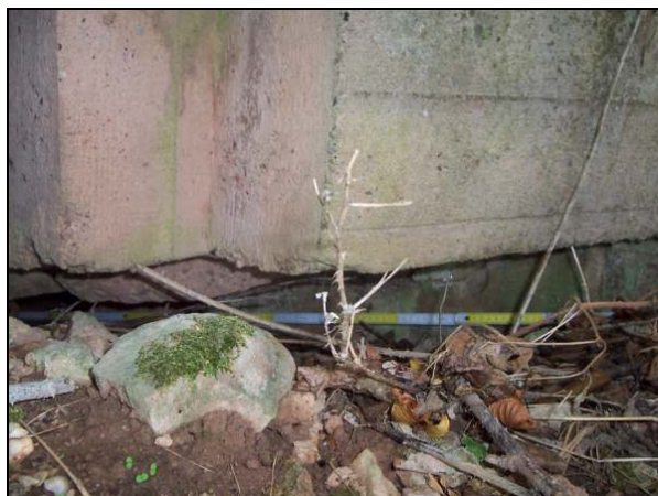
▲ [5016263] Die Frontseite: Blick auf Stufen der PAK-Scharte (oben) und die Schräge darunter.