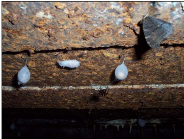
▲ [5016261] An der Decke Spinnen und Schmetterlinge.

Objektnummer 1416 Bauformnummer 19 Heutiger Zustand Ruine, teilweise verschüttet. Stellungskarte 9999