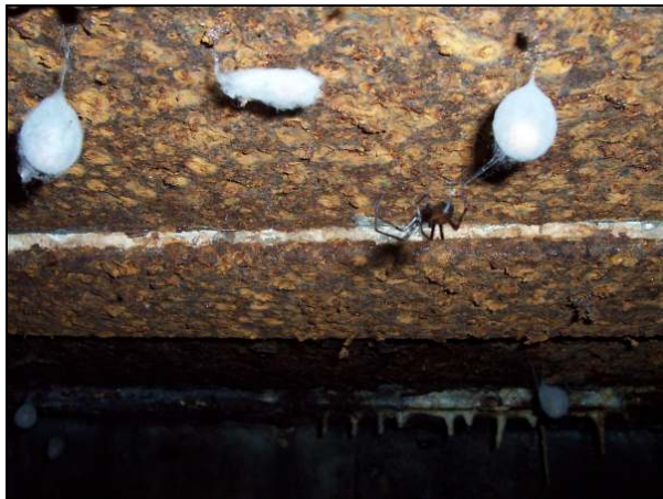
▲ [5016262] An der Decke Spinnen und Schmetterlinge.