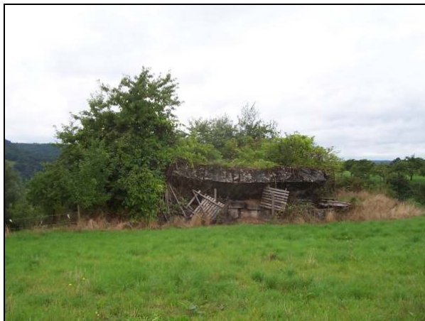
▲ [5016254] Ansicht der Hofseite von Osten. Oberhalb der Hofseite ist die Frontseite der auf dem Kopf liegenden Decke sichtbar.

▲ Regelbauskizze nach B&B (22). Diese Bauform ist die Fortführung des Regelbaus B1-18 für das Limesbauprogramm.