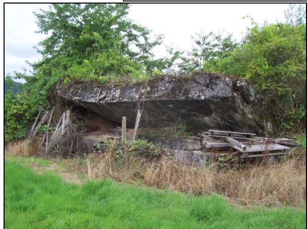
▲ [5016255] Ansicht der Hofseite von Norden. Oberhalb der Hofseite ist die Frontseite der auf dem Kopf liegenden Decke sichtbar.