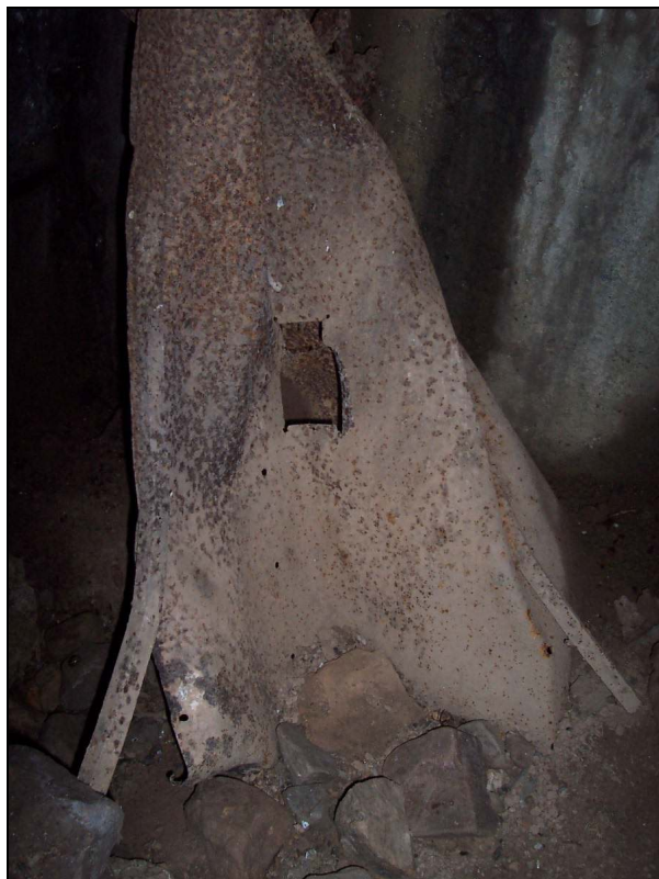
▲ [5016260] Die zerdrückte Gasschutzblechtür Typ 19P7 hatte ein kleines Fenster.

Objektnummer Bauformnummer Heutiger Zustand Stellungskarte 1416 19 Ruine, teilweise verschüttet. 9999