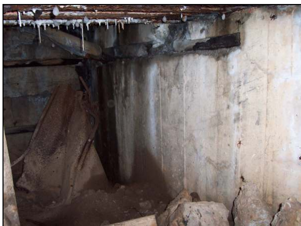
▲ [5016258] Blick durch den Mannschaftseingang in die Gasschleuse. Im Hintergrund eine zerdrückte Gasschutzblechtür Typ 19P7.