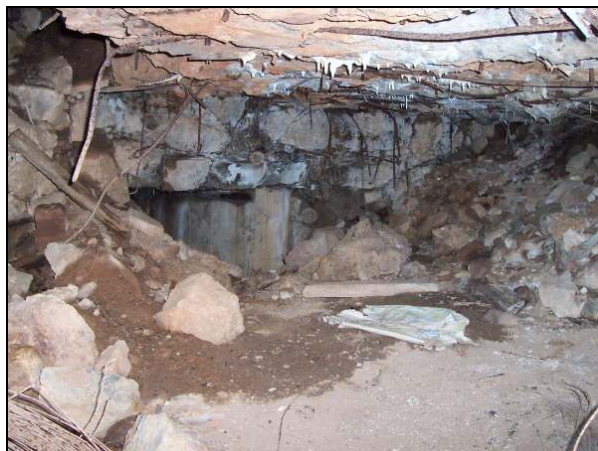
▲ [5016257] Blick vom PAK-Tor in den verschütteten Hof. Links der Mannschaftseingang.