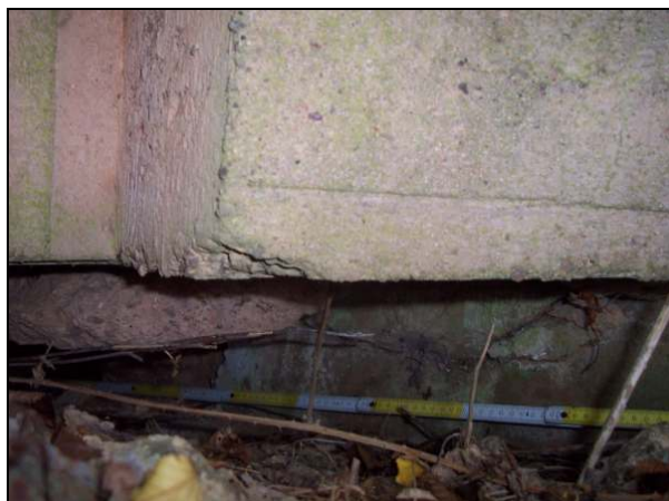
▲ [5016264] Die Frontseite: Blick auf Stufen der PAK-Scharte (oben) und die Schräge darunter.