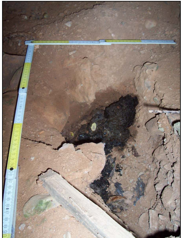
▲ [5016265] Eine Kotmulde im Kampfraum deutet auf Besiedlung hin.