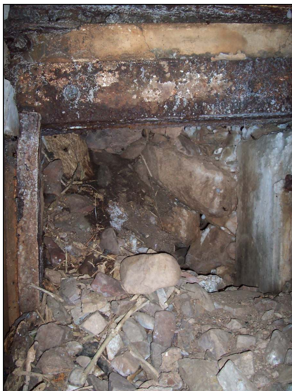
▲ [5016259] Blick von der Gasschleuse in die verschüttete Flankierungsanlage.