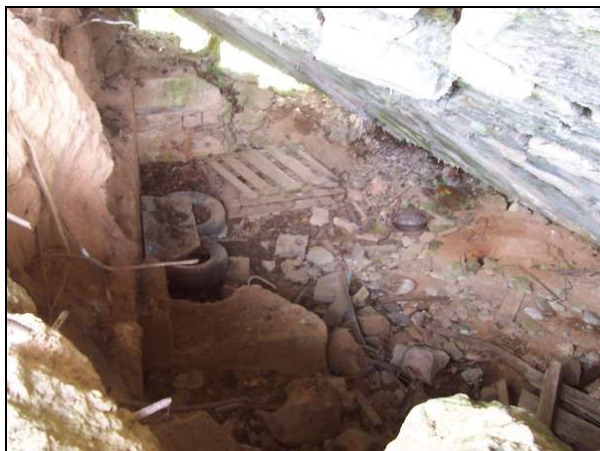
▲ [5016256] Blick von der Hofmauer in den Munitionsraum im Vordergrund und den PAK-Kampfraum im Hintergrund.

Objektnummer Bauformnummer Heutiger Zustand Stellungskarte 1416 19 Ruine, teilweise verschüttet. 9999